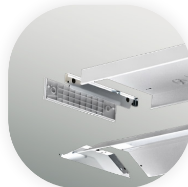
Montagefreundlich mit magnetischer Endkappe