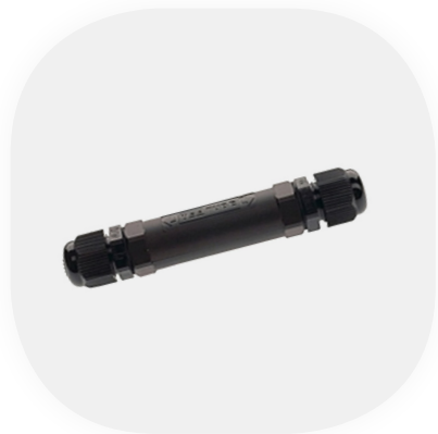
3-pol. Verteiler Schutzart IP68 Inklusive Klemmenstein für Leitungsdurchmesser 6-12mm