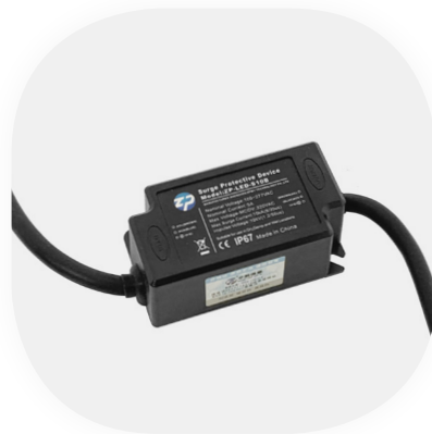
Überspannungsschutz für eine Leuchte bis 600W Schutzart IP67

*Nach DIN VDE 0100-443 und -534 ist ein Überspannungsschutz seit Dezember 2018 Pflicht.